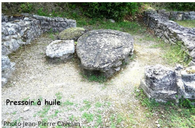
Pressoir à huile