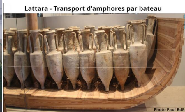
Lattara - Transport d'amphores par bateau