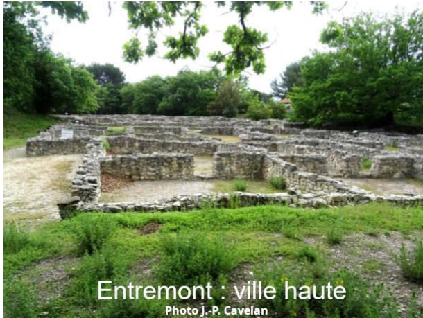
Entremont : ville haute

La ville haute est constituée d'îlots d'habitation, réguliers, séparés par des rues de 3m permettant le passage de charrettes.