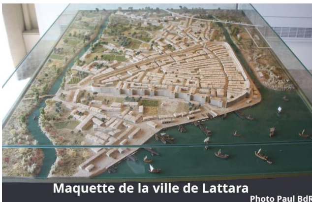
Maquette de la ville de Lattara

Le site archéologique Lattara révèle le riche passé de l'ancien port de Lattara, édifié dans le delta du Lez, occupé du VI e siècle avant notre ère jusqu'au III e siècle de notre ère. Cette ville antique a vu se côtoyer Étrusques, Grecs, Ibères, Romains et populations gauloises locales. S'étendant sur près de 5 hectares, le site fait l'objet de campagnes de fouille programmées réalisées par le CNRS (UMR 5140) de manière à continuer l'étude historique de Lattara.