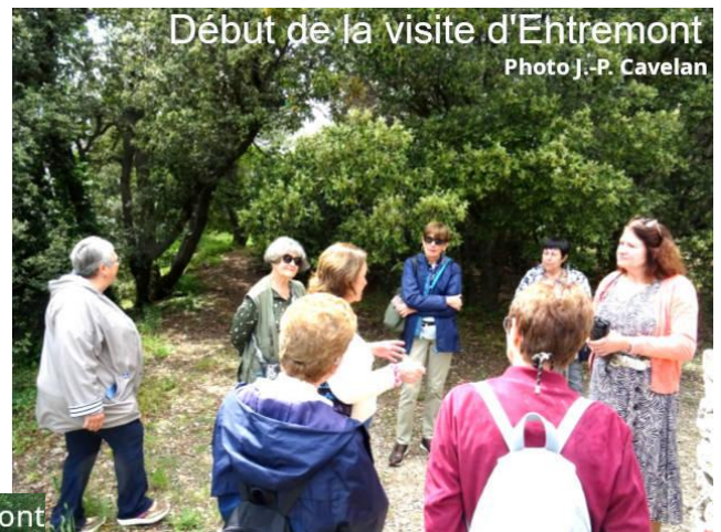
Début de la visite d'Entremont