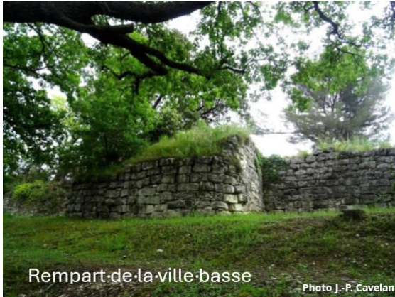
Rempart de la ville basse