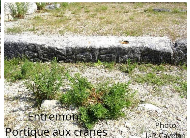
Entremont Portique aux crânes