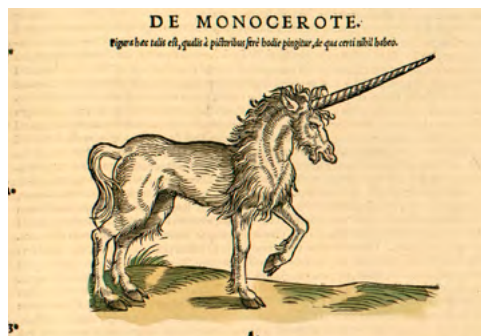
Vu page 46 du livre Préhistoires imaginaires : représentation de licorne européenne (d'après Gessner, 1551)