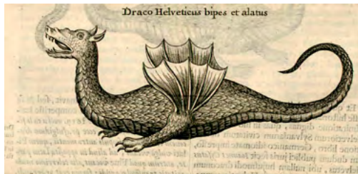
Vu page 58 du livre Préhistoires imaginaires : figuration d'un dragon bipède ailé (d'après Kircher, 1665).

– B. R. : Oui c'est sûr qu'il y a eu un « krach » de la licorne ! Effectivement parce que la science s'est rendu compte que l'histoire n'était pas crédible. Mais aussi parce que, en fait de corne de licorne, il s'agissait bien souvent de défense de narval, ce cétacé qui vit dans l'océan Arctique. Les voyages sur les terres d'Europe du nord – et les grandes explorations en général – ont bel et bien sonné le glas du commerce de la corne de licorne !